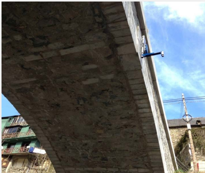
Estación de Sensores SmartyRiver400 sobre el puente de Aubèrt.