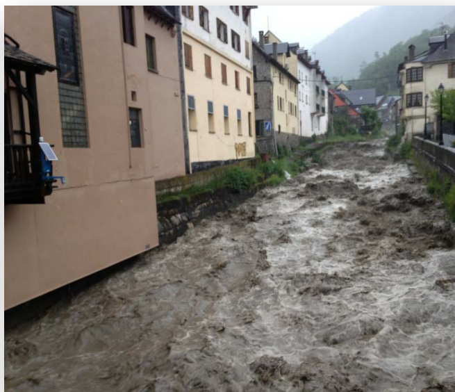
Estacion de Sensores SmartyRiver 400 sobre el río Nere en la población de Vielha.