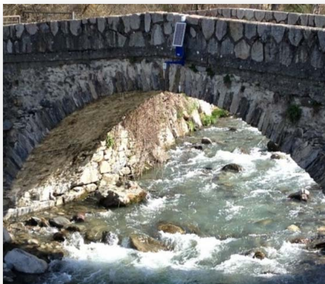
Estación de Sensores SmartyRiver400 sobre el puente de Escunhau antes de la avenida